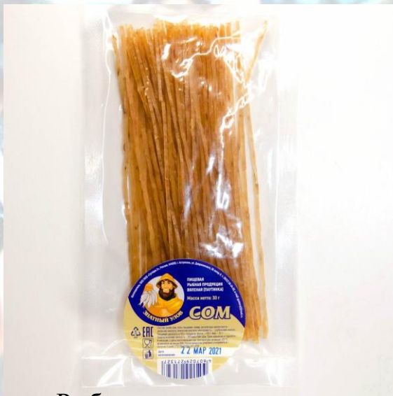
Рыба вяленая - паутинка