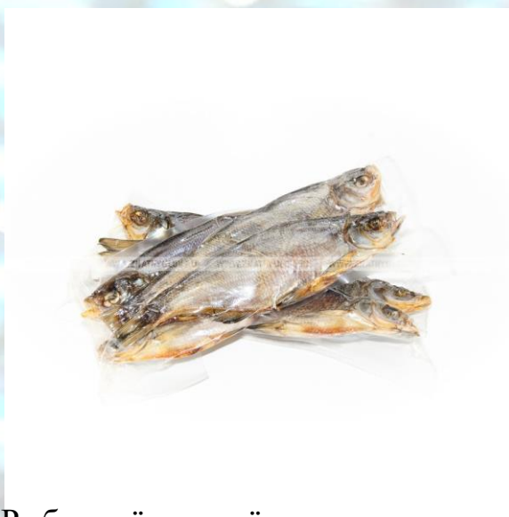
Рыба солёно-сушёная неразделанная